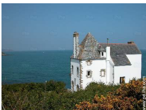
vista sobre el mar