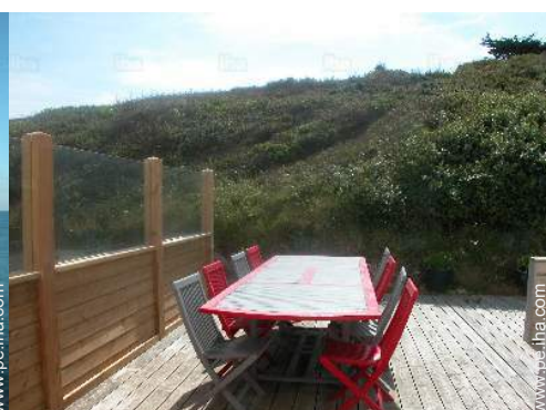
vista desde la cocina