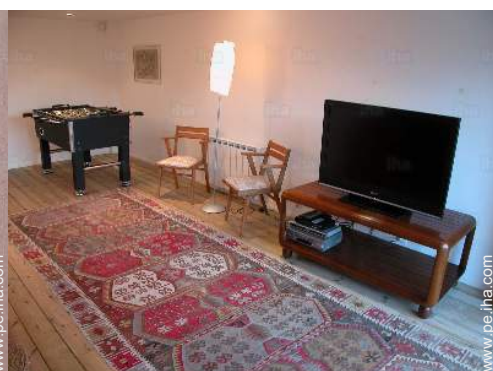
Instalaciones de ocio