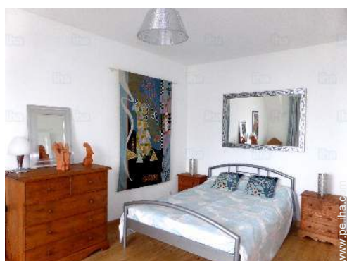
cuarto de invitados