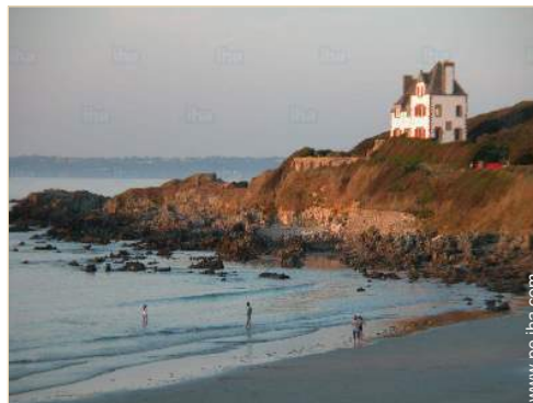
acceso directo playa