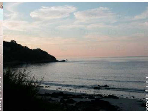
vista sobre la apuesta del sol