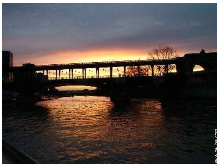
vista sobre la puesta del sol