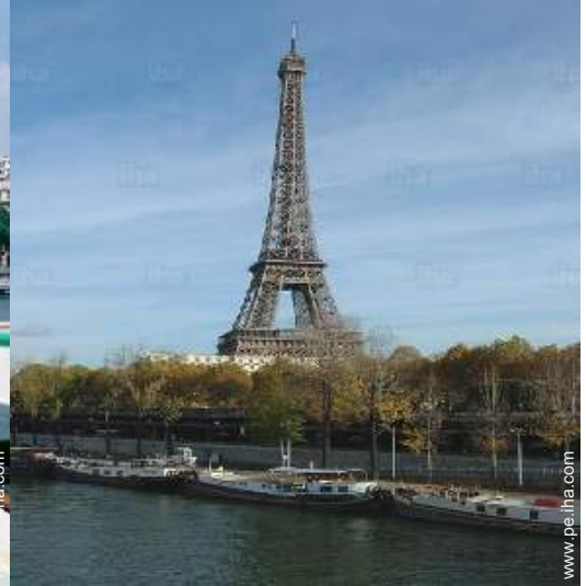
en el muelle