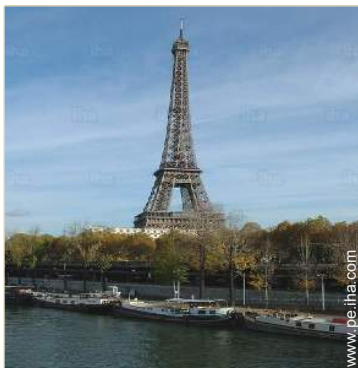
en el muelle