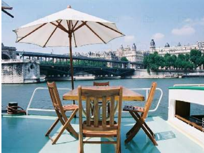
vista sobre el río