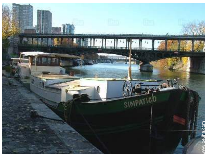
en el muelle