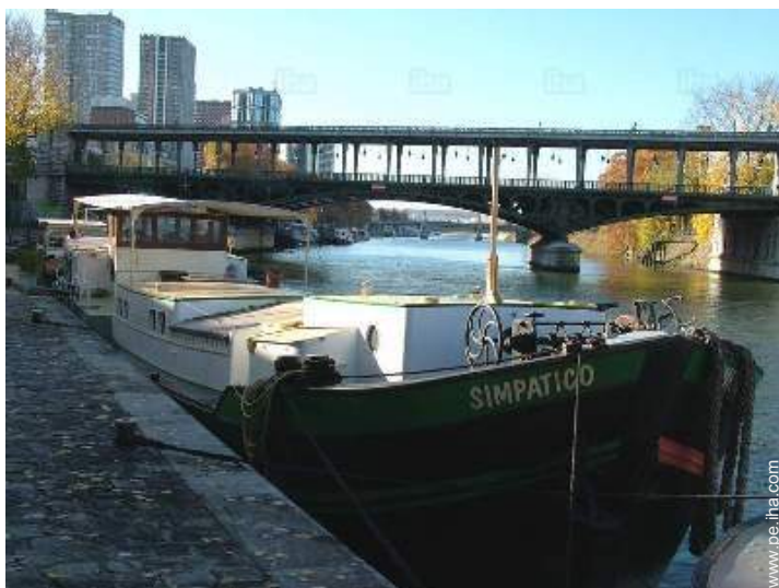
en el muelle