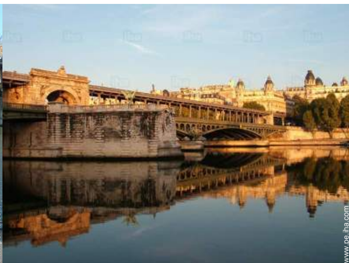
vista sobre el río