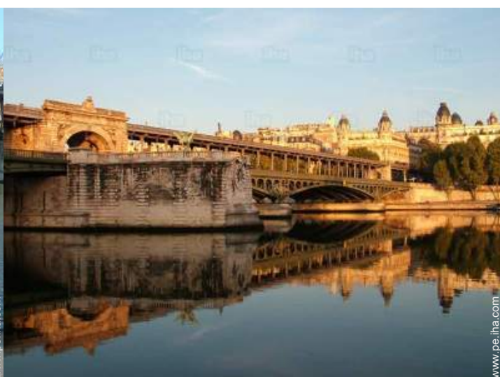
vista sobre el río