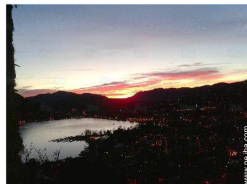
vista sobre la apuesta del sol

Mesa(s) de jardín, 6 silla(s) de jardín, sombrilla, 2 tumbona(s)