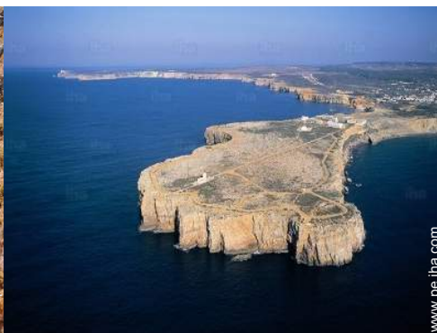
actividades balnearias cercanas