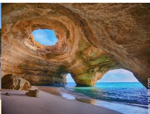
actividades balnearias cercanas