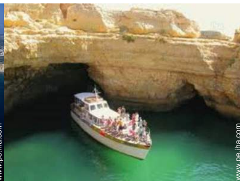
actividades balnearias cercanas