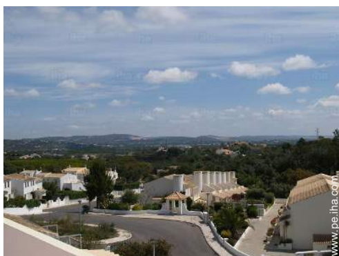
vista desde la veranda