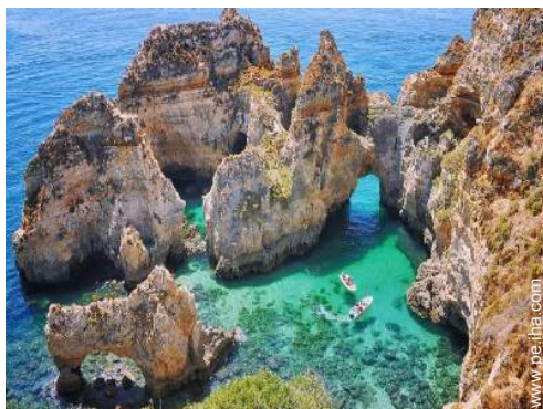
actividades balnearias cercanas