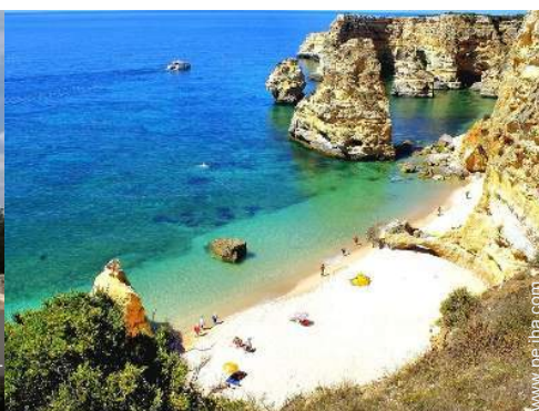
actividades balnearias cercanas