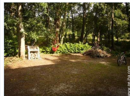
vista sobre el bosque