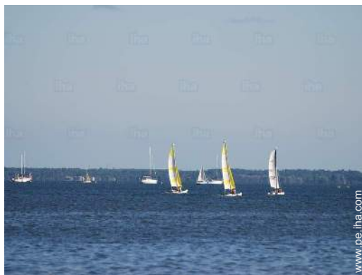
actividades náuticas cercanas