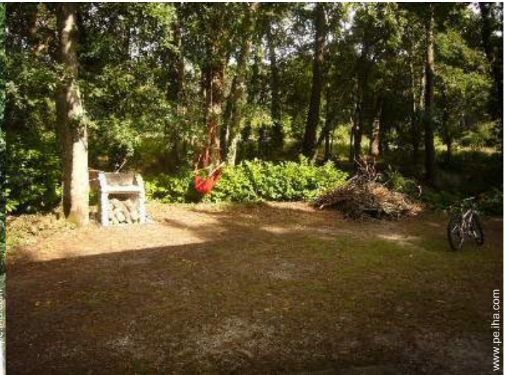
vista sobre el bosque