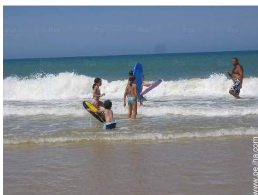
vista sobre el océano