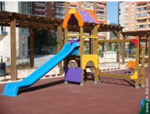
parque y jardin