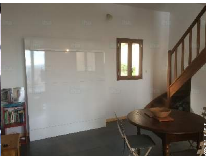
cama(s) mueble(s) 2 pers