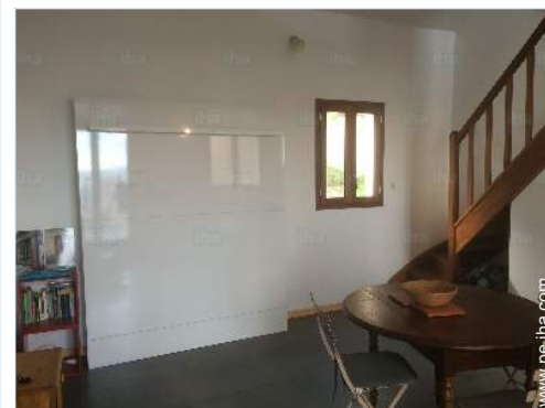
cama(s) mueble(s) 2 pers

Alquiler de bici/MTB 15km Alquiler de barco 15km Alquiler de equipo de buceo 15km Alquiler de Ropa blanca/lavandería 15km Panadería 3km Pequeños comercios 3km Supermercado 7,5km Peluquería 7,5km Correos 7,5km Cajero automático 15km Farmacia 7,5km Doctor 7,5km Enfermera 7,5km Hospital 25km