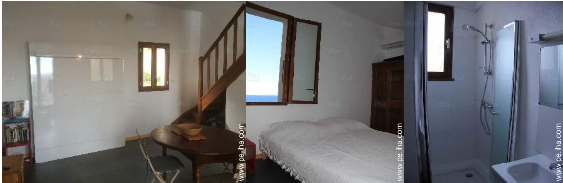
cama(s) mueble(s) 2 pers