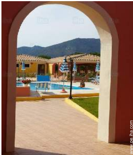
vista desde la piscina