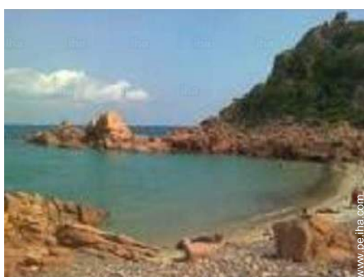
vista sobre el mar