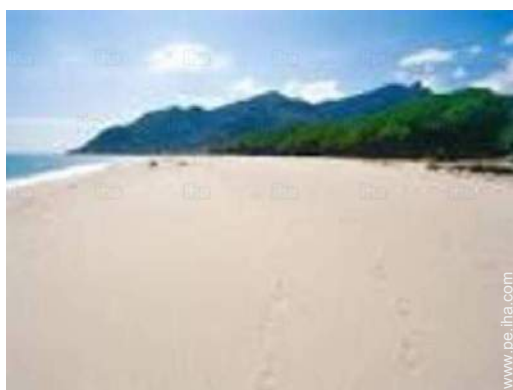
vista sobre el mar