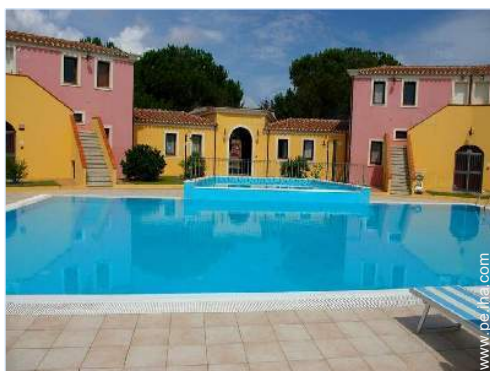
Piscina a desbordamiento