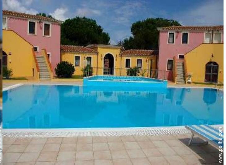
Piscina a desbordamiento