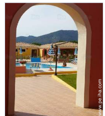
vista desde la piscina