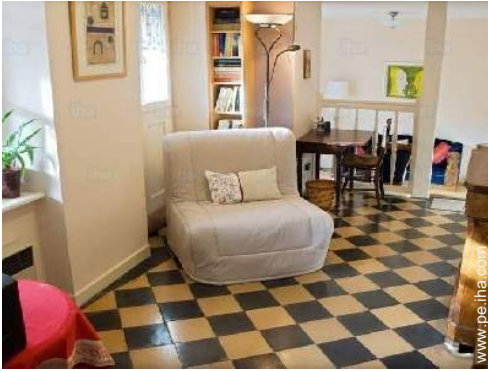
sofá cama 1 pers