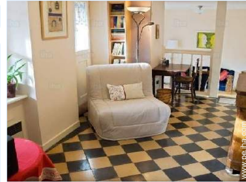
sofá cama 1 pers