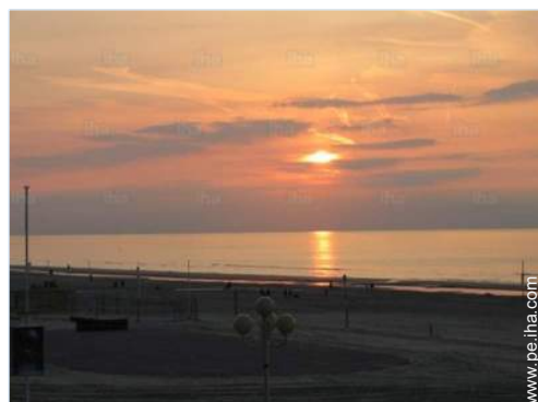
vista sobre la apuesta del sol