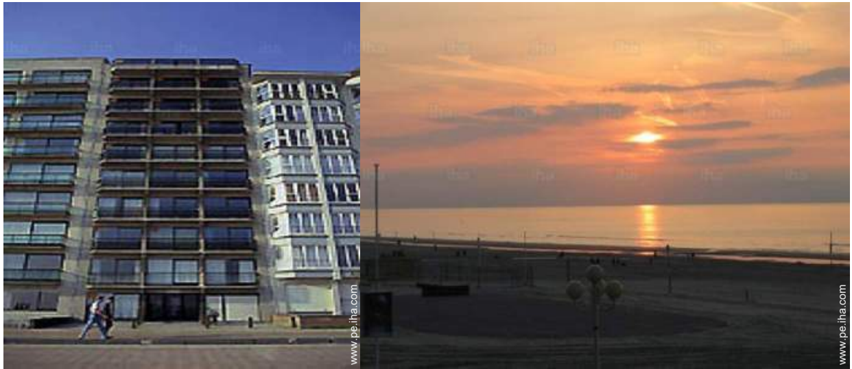
vista sobre la apuesta del sol