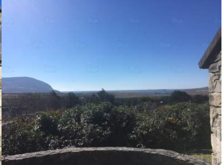
vista desde el patio