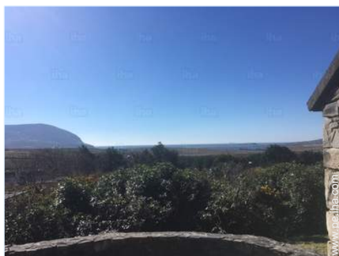
vista desde el patio