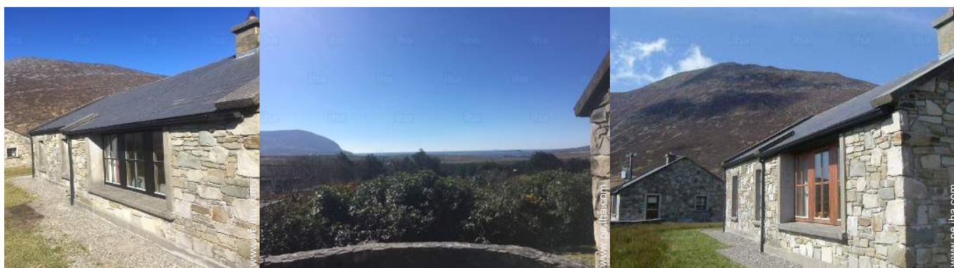
vista desde el patio