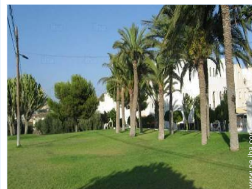
vista de conjunto