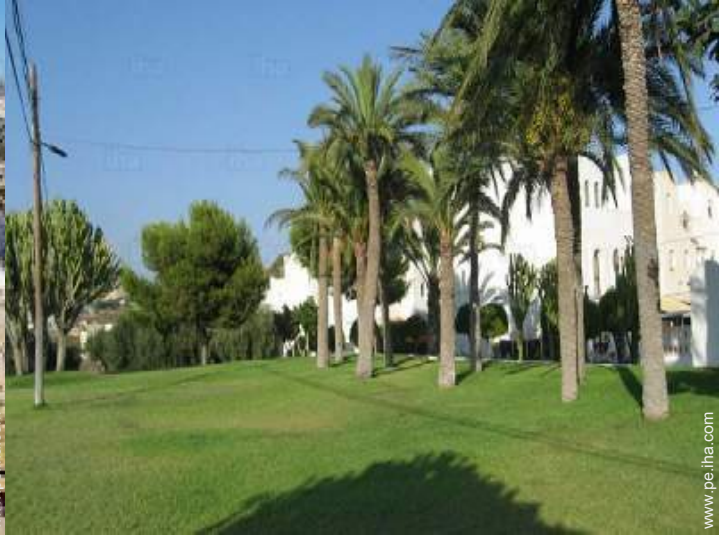
vista de conjunto