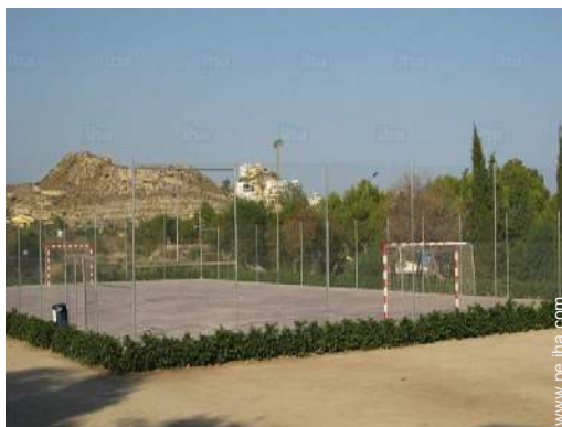
instalación de ocio