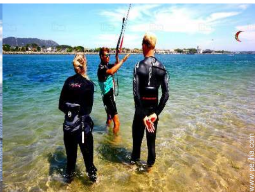
actividades náuticas cercanas