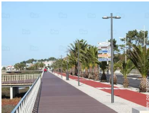
actividades de ocio de verano cercanas