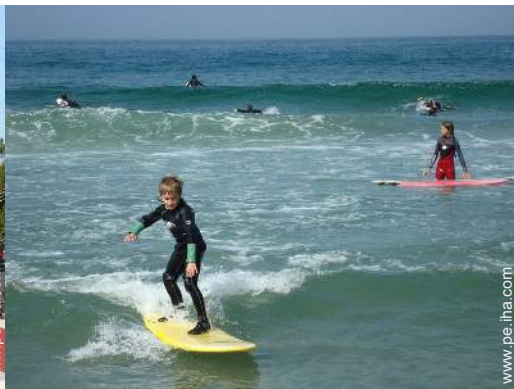
actividades náuticas cercanas