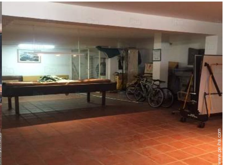
sala de juegos