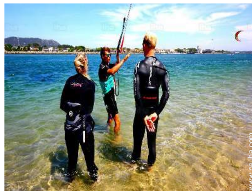
actividades náuticas cercanas