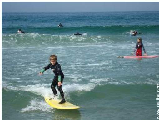
actividades náuticas cercanas