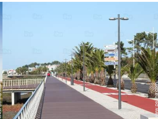
actividades de ocio de verano cercanas