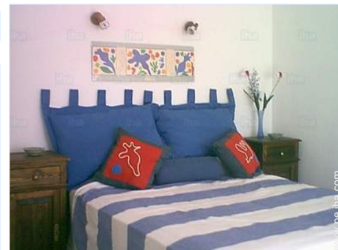
habitación del propietario

Parrilla, mesa(s) de jardín, 10 silla(s) de jardín, sombrilla, 4 reposera(s), ducha exterior