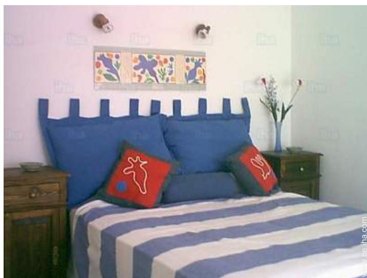
habitación del propietario