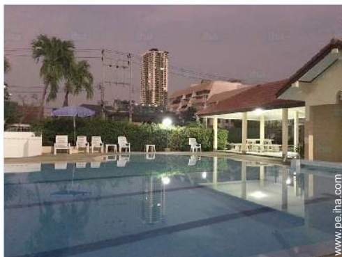
piscina en la residencia