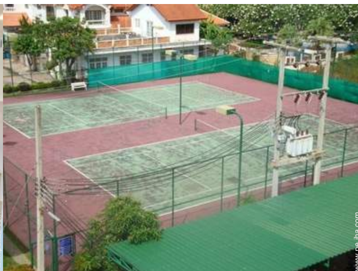
Instalaciones de ocio