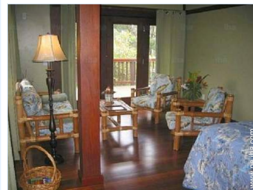
Disposición interior privado

Guardería 2,5km El centro 2,5km Parada/estación de guagua 800m Alquiler de bici/MTB 10km Alquiler de moto/escúter 20km Alquiler de carro 20km Alquiler de barco 7,5km Alquiler de equipo de buceo 7,5km Alquiler de Ropa blanca/lavandería 7,5km Catering 2,5km Pequeños comercios 2,5km Peluquería 2,5km Cibercafé 2,5km Correos 2,5km Banco 7,5km Cajero automático 7,5km Farmacia 2,5km Doctor 2,5km Enfermera 2,5km Hospital 20km Dispensario 7,5km