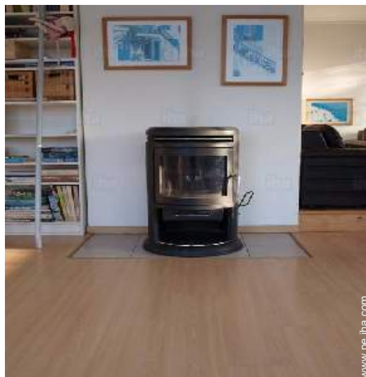
estufa de madera