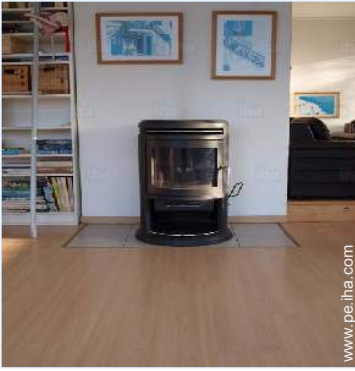
estufa de madera