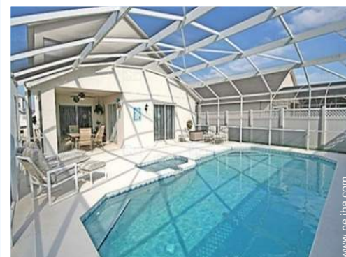
vista sobre la piscina