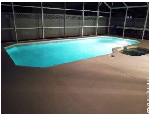
vista sobre la piscina