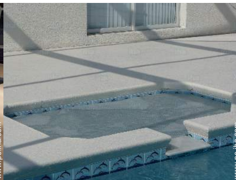
vista sobre la piscina