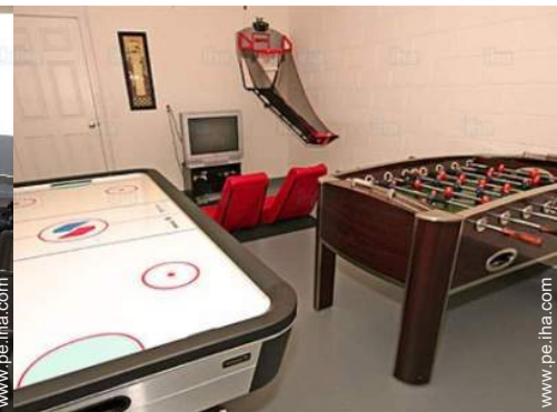
Instalaciones de ocio