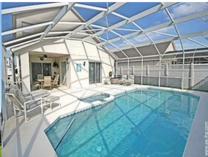
vista sobre la piscina