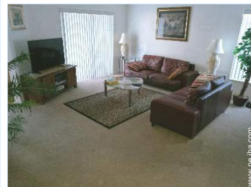
sala de televisión

El centro Parada/estación de guagua 500m Alquiler de carro 4km Panadería 2km Pequeños comercios Supermercado 800m Comercios de lujo y de marcas 5km Correos 4km Banco 2km Cajero automático 2km Doctor 5km Hospital 7,5km