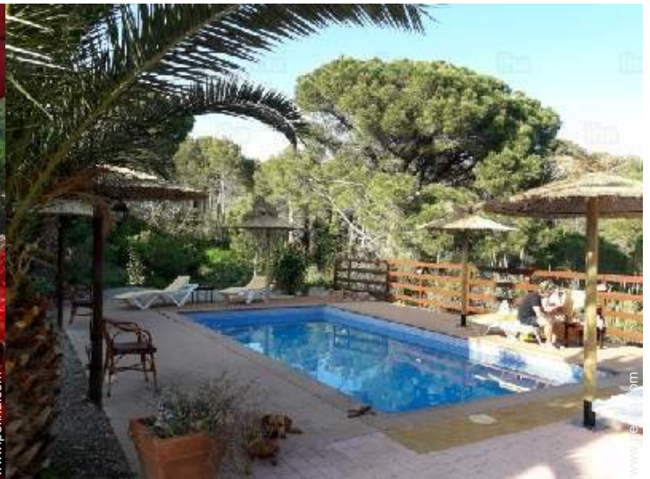
vista sobre el jardin/parque