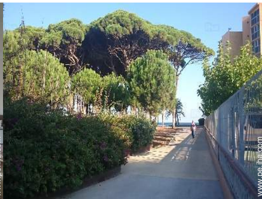
vista sobre la calle peatonal