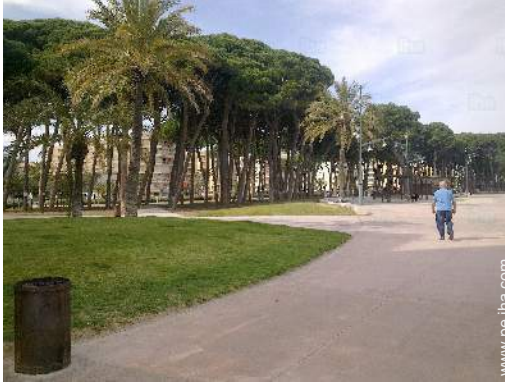
vista sobre la calle peatonal