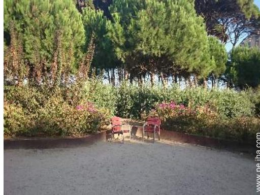
parque y jardin