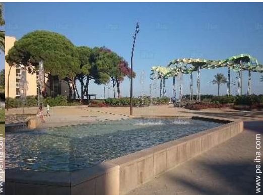
vista sobre el jardin/parque