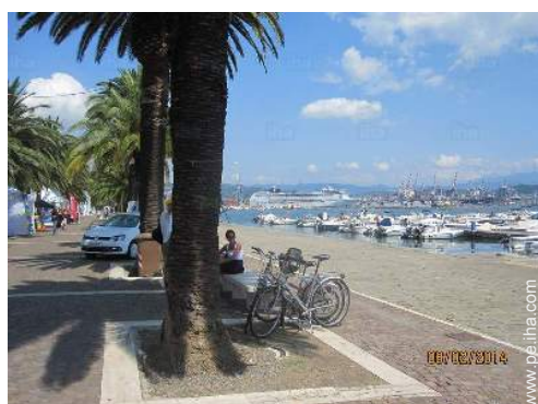
Zonas atractivas y relajación