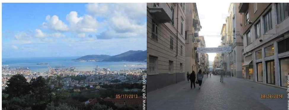
vista sobre la ciudad