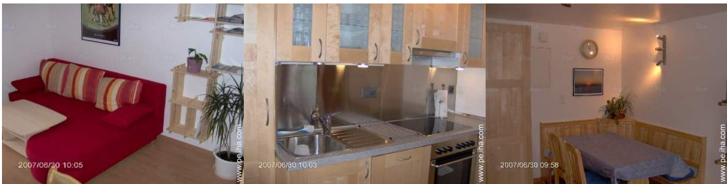
cuarto de estar