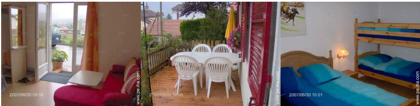
vista desde el cuarto de estar