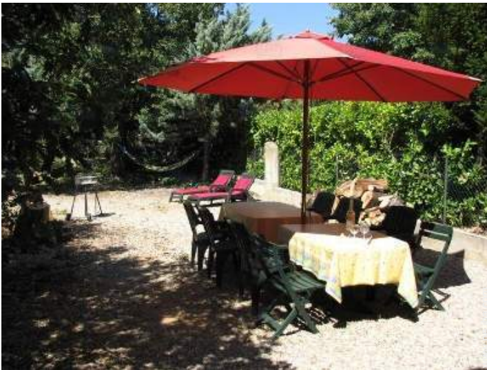
vista sobre el jardín/parque