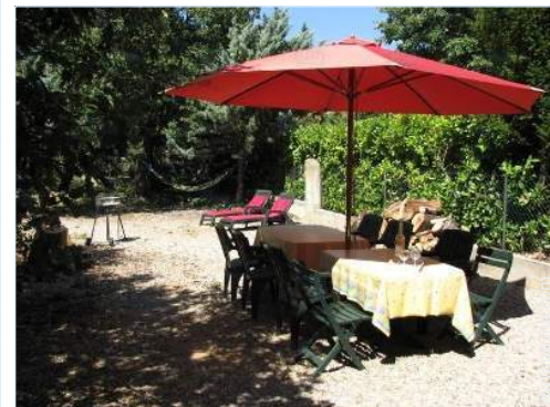
vista sobre el jardín/parque