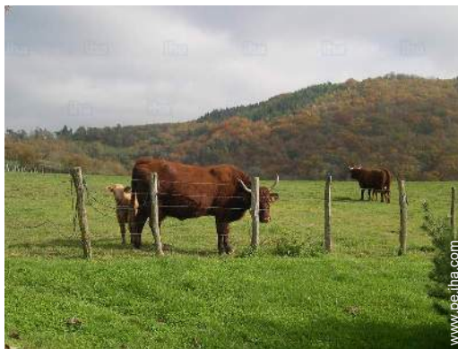
vista sobre el campo