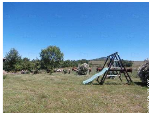
instalación de ocios