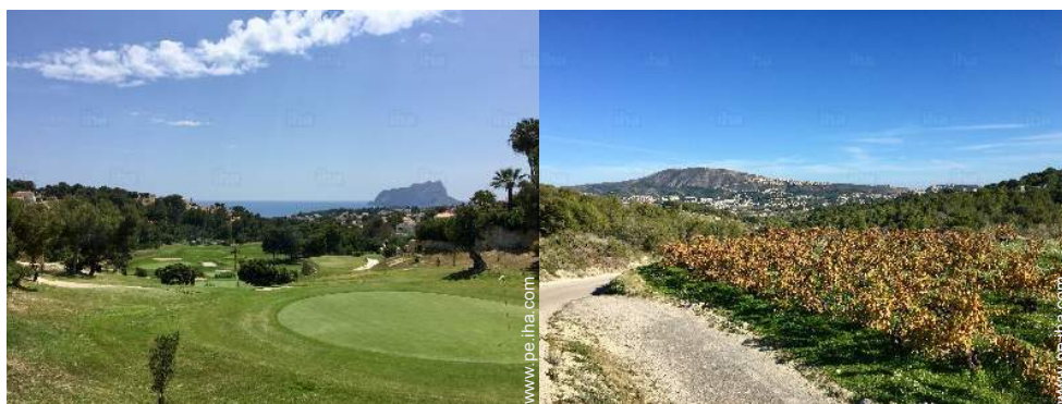
recorrido de golf 9 hoyos