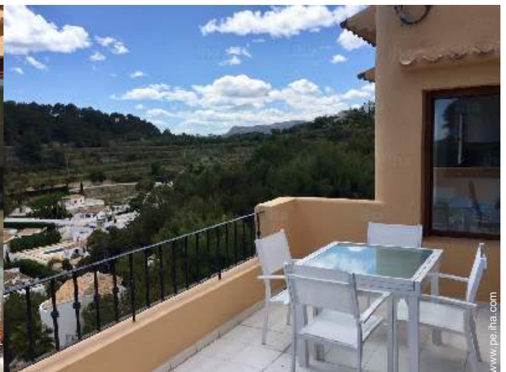
vista sobre la montaña