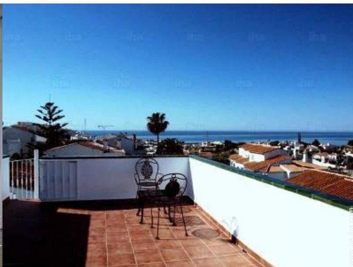
vista sobre las azoteas