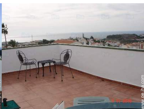
vista desde la azotea