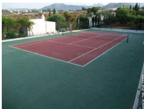
Tenis - superficie sintética