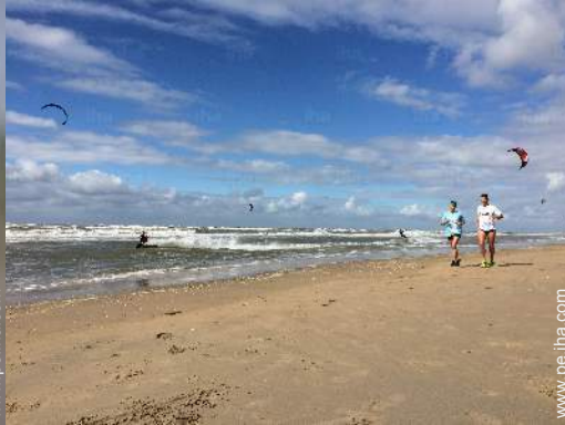
actividades de ocio de verano cercanas