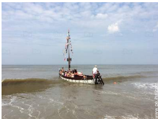
excursión en barco