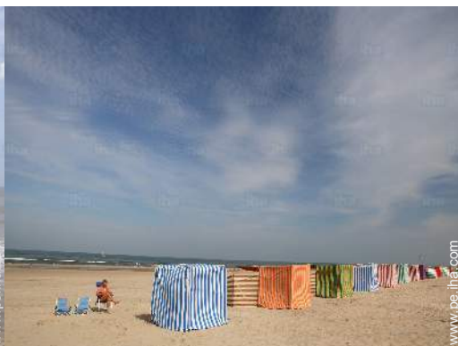
actividades balnearias cercanas