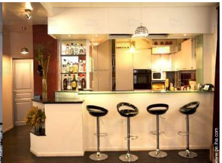
gran cocina americana