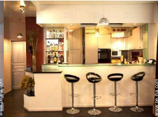
gran cocina americana