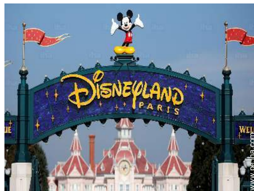
parque de atracciones