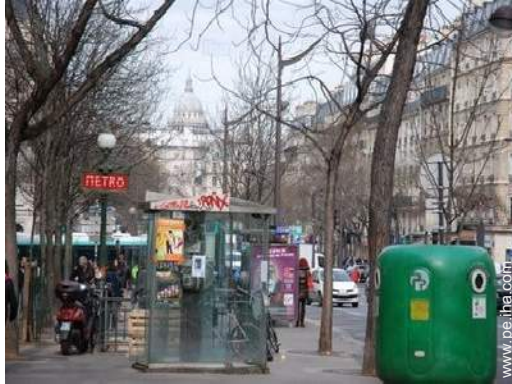
estación de metro