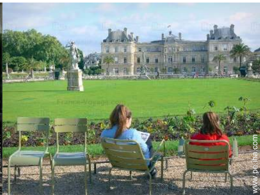
parque y jardín