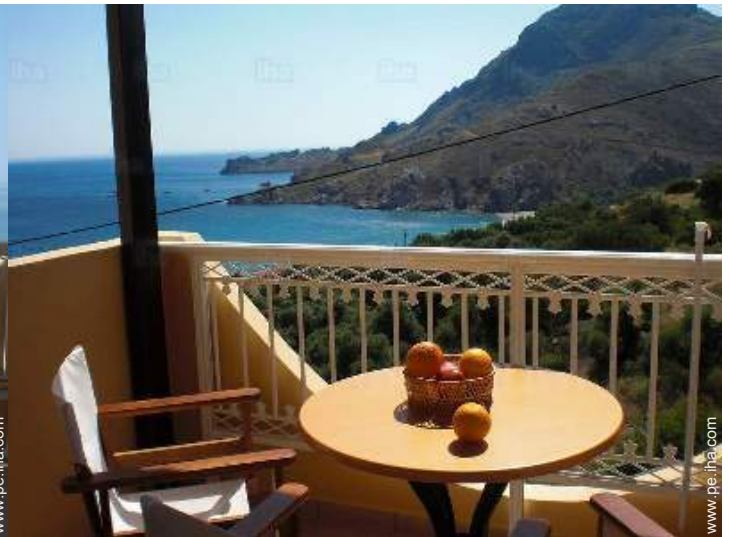
vista desde el balcón