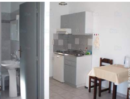
vista desde el apartamento