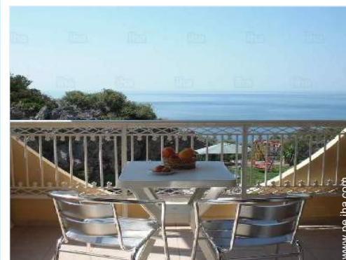
vista sobre el mar