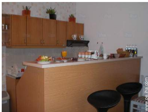
vista desde la cocina