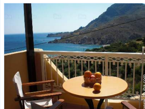
vista desde el balcón

Mar/océano 300m Playa de arena 300m Playa de guijarro 300m Playa de roca 300m Playa nudista 300m Cala 500m Descensos 15km Cascada 15km Acantilado 300m Río 15km Estanque 800m Lago 20km Bosque 7,5km Cadena montañosa 7,5km Puerto deportivo 1,5km