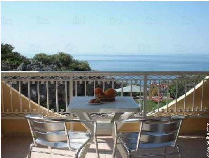
vista sobre el mar