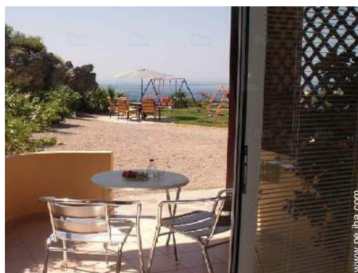
vista desde el jardín/parque