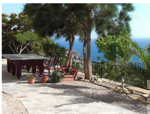
vista desde la terraza