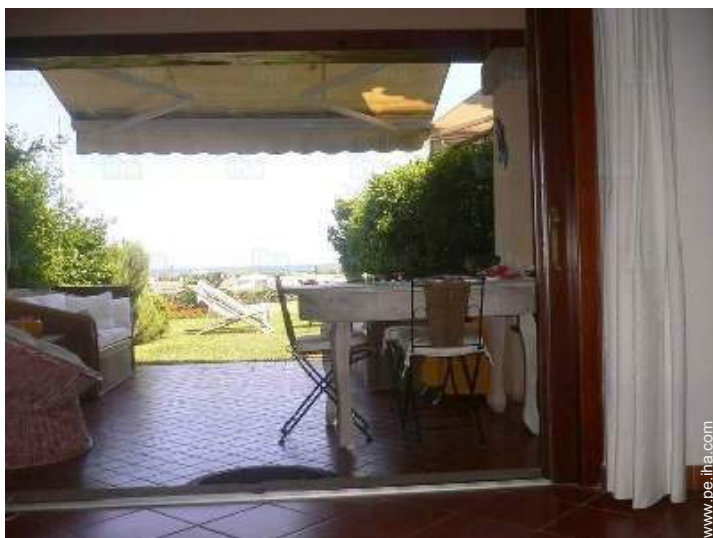
vista desde el patio