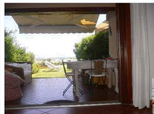
vista desde el patio