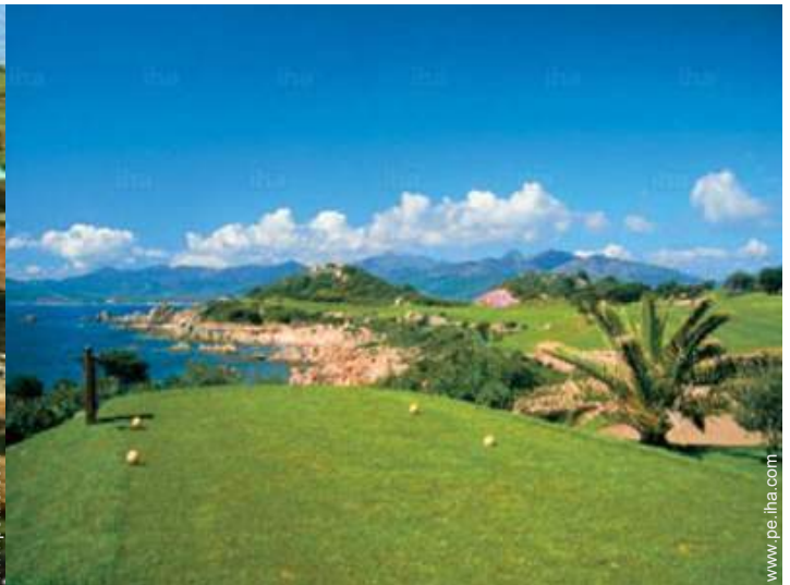
recorrido de golf privado