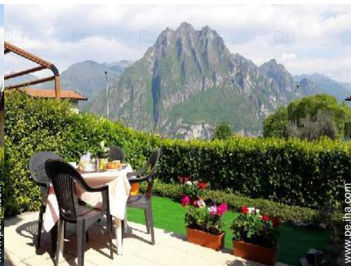
vista sobre el patio