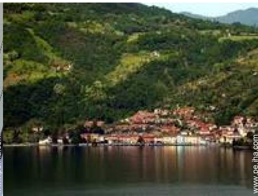
vista sobre el lago