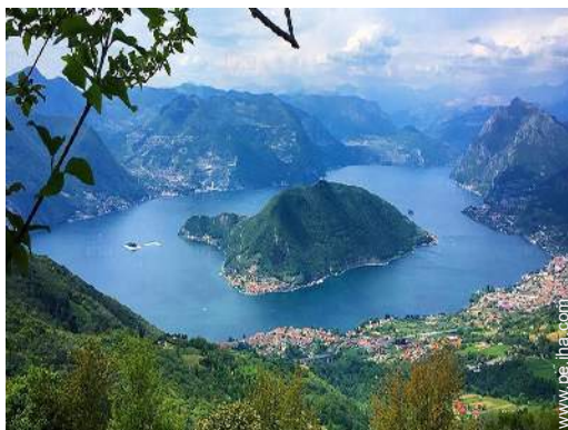
vista sobre el lago