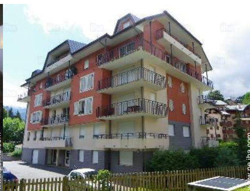
Residencia de lujo