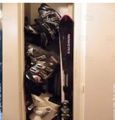
local de esquí