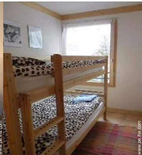
área de descanso