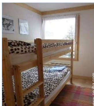
área de descanso