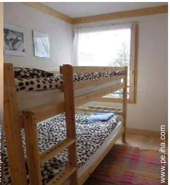
área de descanso