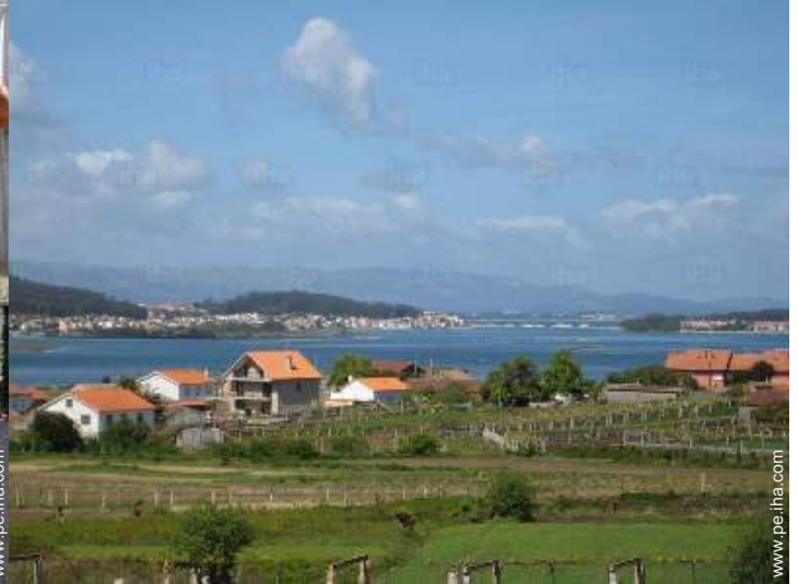
vista desde el balcón