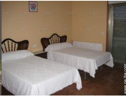
camas gemelas sencilla