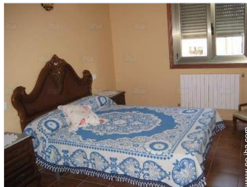
cama de matrimonio