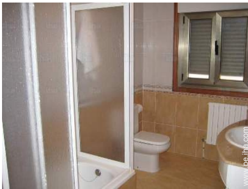
cuarto de baño