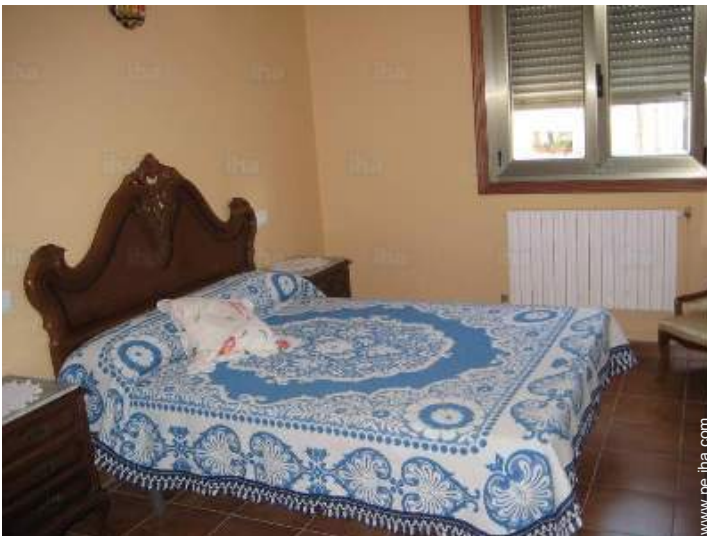
cama de matrimonio