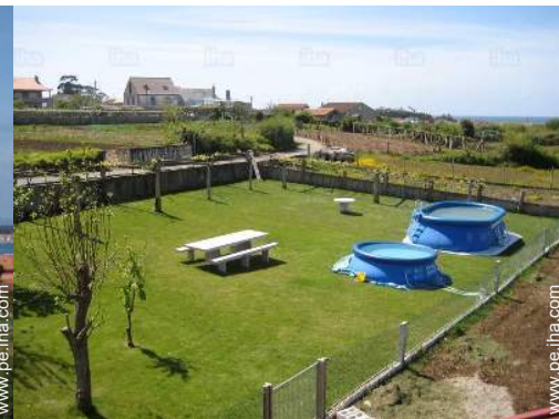
vista desde el balcón