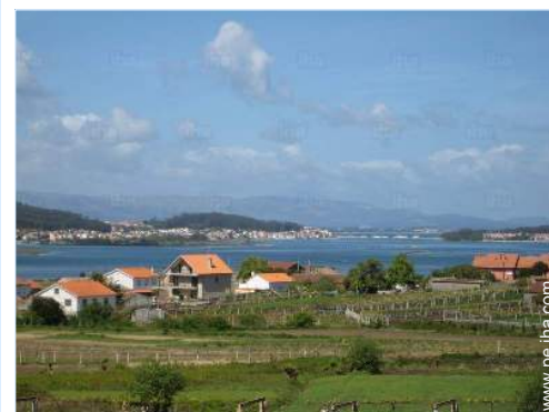
vista desde el balcón