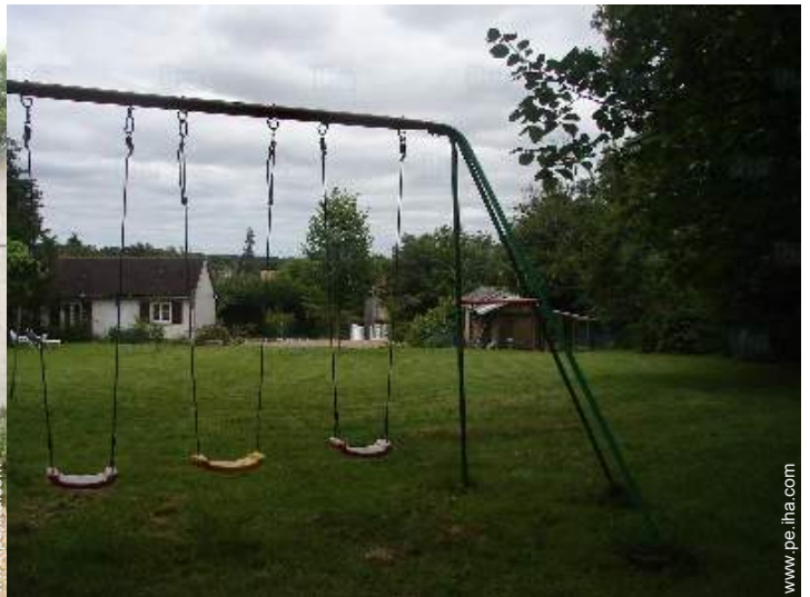
instalación de ocio