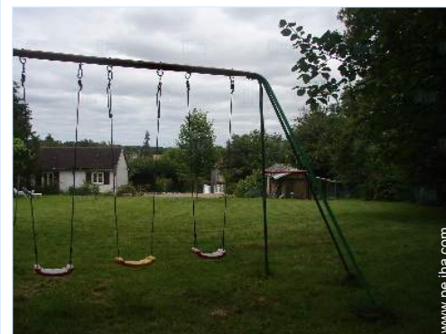
instalación de ocios