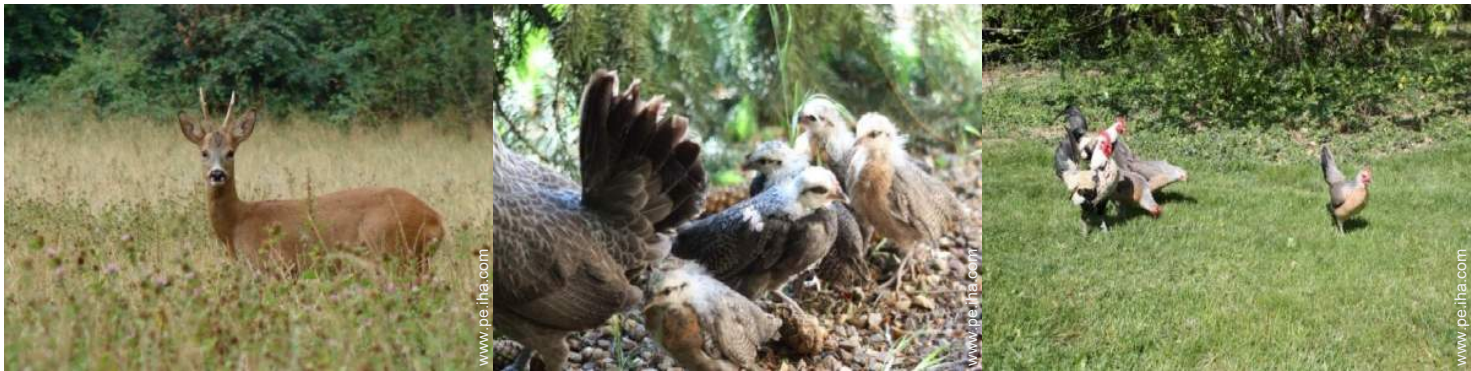
vista sobre el campo