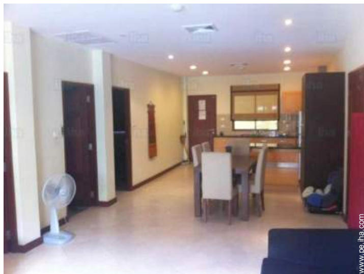
vista desde le comedor