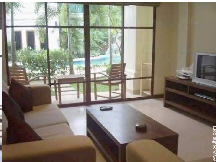
vista desde el apartamento