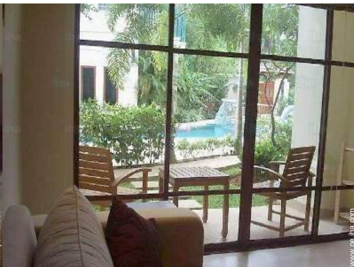
vista desde el dormitorio