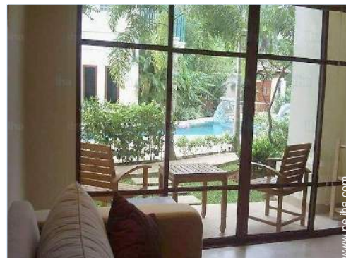
vista desde el dormitorio