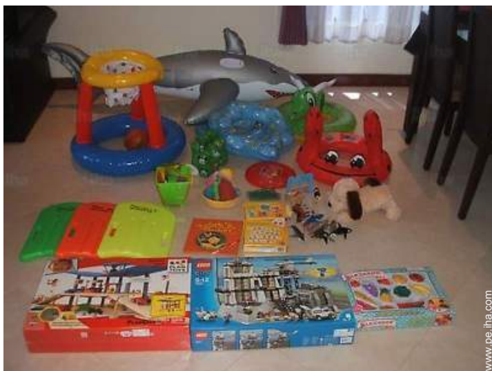
instalación de ocios