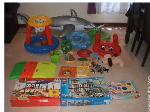
instalación de ocios

Playa de arena 300m Recorrido de golf 18 hoyos 7,5km Puerto deportivo 15km