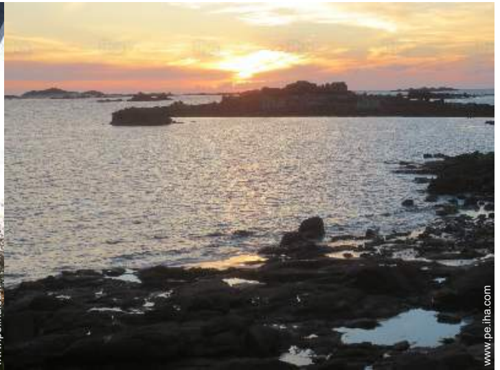
vista sobre la apuesta del sol