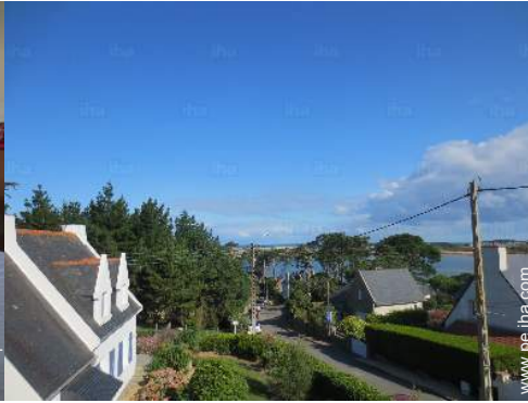
vista desde el dormitorio