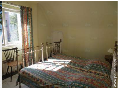
cuarto de invitados