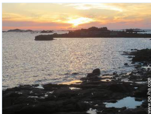
vista sobre la puesta del sol