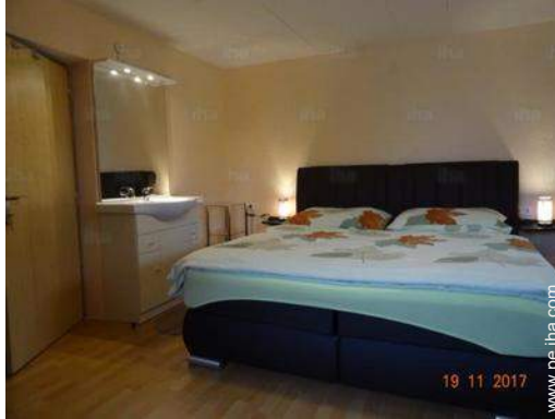
cuarto de invitados