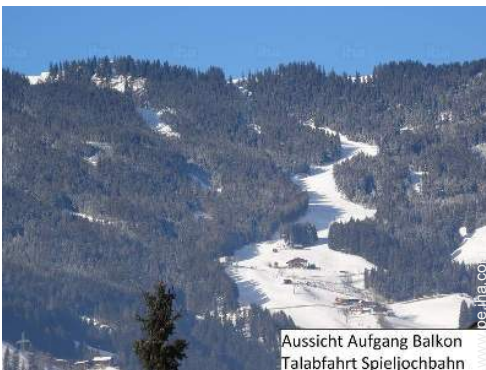
Aussicht Aufgang Balkon Talabfahrt Spieljochbahn