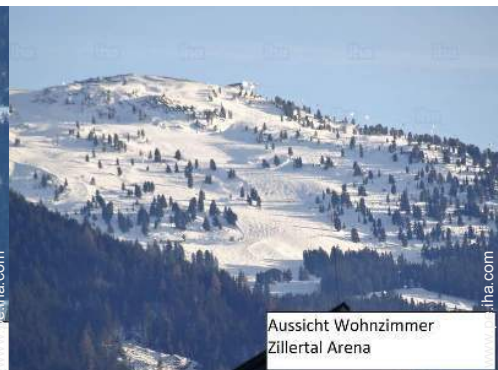
Aussicht Wohnzimmer Zillertal Arena