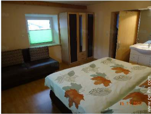
cuarto de invitados