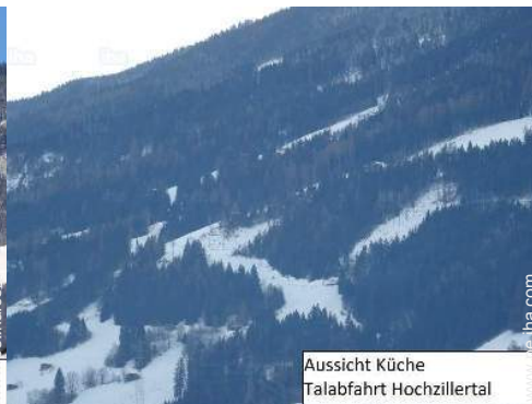
Aussicht Küche Talabfahrt Hochzillertal