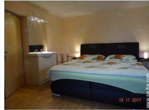
cuarto de invitados