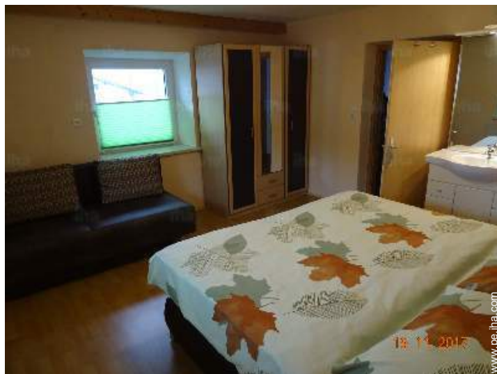
cuarto de invitados