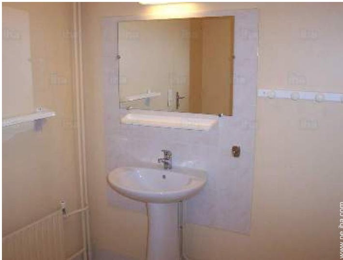
cuarto de baño