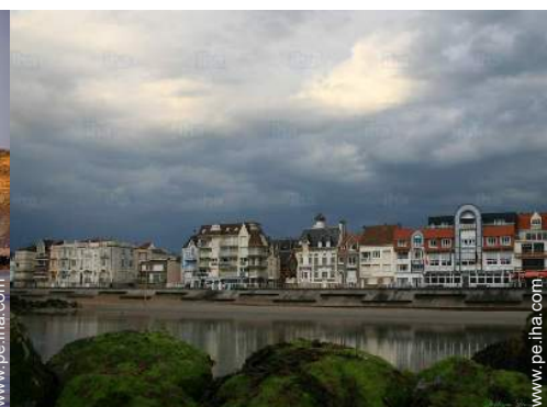
playa de arena