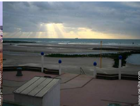
playa de arena