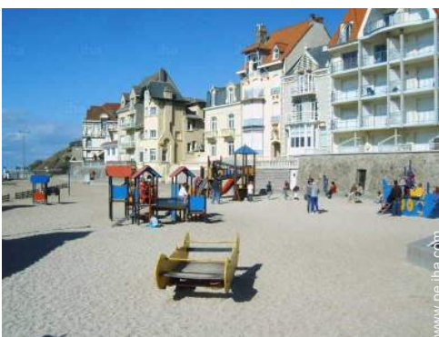
actividades de ocio cercanas