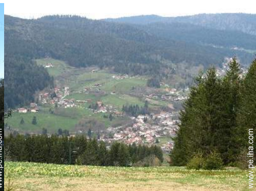
centro del pueblo