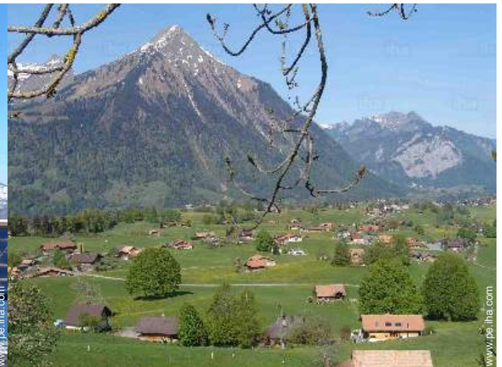
vista sobre la montaña