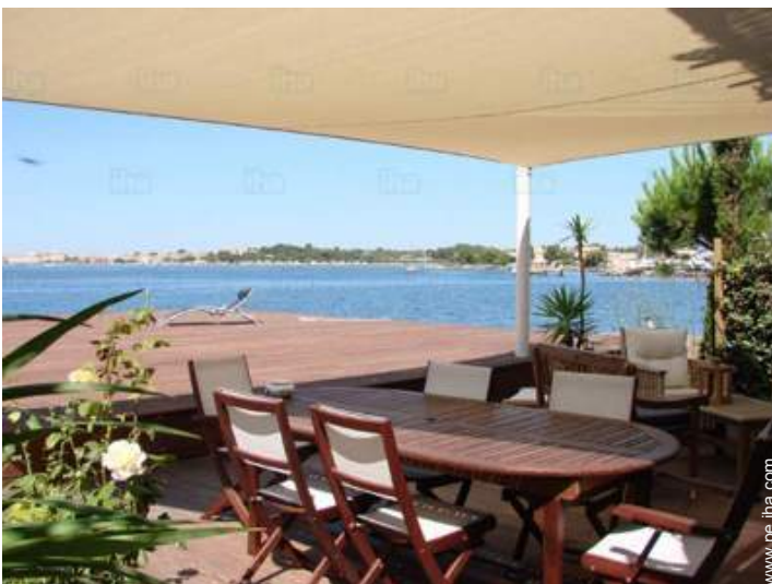
vista desde la terraza cubierta