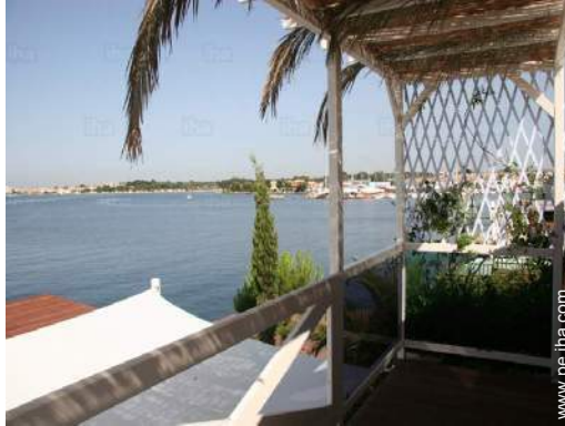
vista desde el balcón