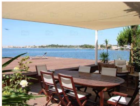
vista desde la terraza cubierta

Niños bienvenidos Animales aceptados Cobertura teléfono móvil, transporte personal recomendado Agua : caliente/fría Tensión eléctrica : 220V / 60Hz Corriente eléctrica : red (eléctrica)