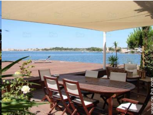
vista desde la terraza cubierta