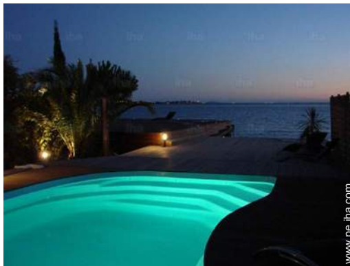
vista sobre la apuesta del sol