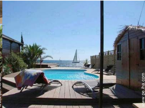
vista desde la piscina