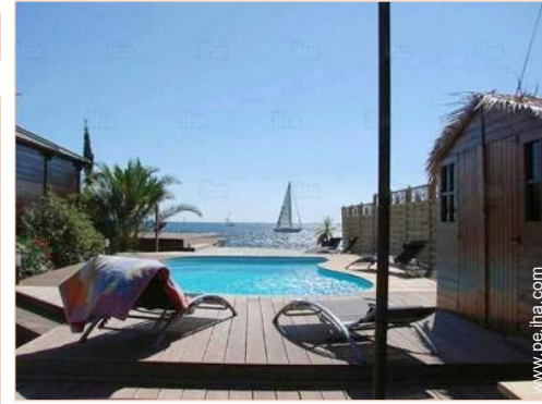
vista desde la piscina

Salón de té, parrilla, mesa(s) de jardín, 10 silla(s) de jardín, cenador, área de jardín, 8 tumbona(s), ducha exterior