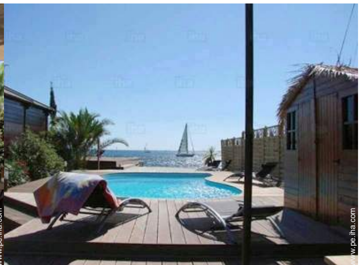
vista desde la piscina