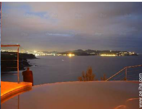
Piscina a desbordamiento