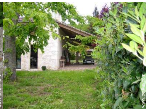
Casa de Piedra con Encanto