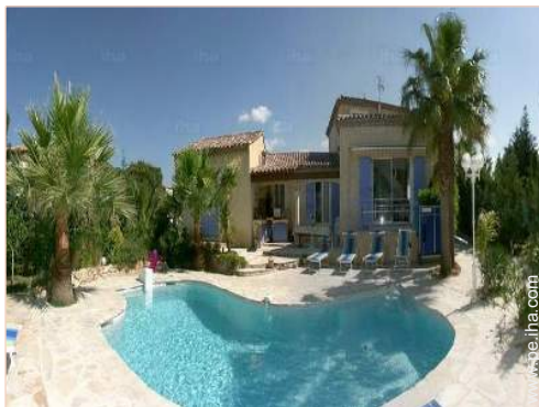
vista sobre el jardín/parque