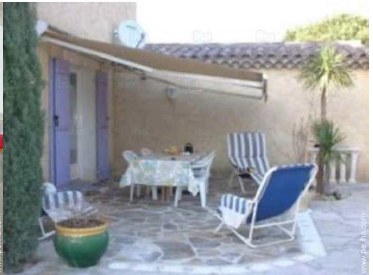
área de jardín