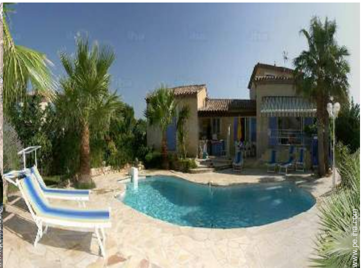
vista desde la terraza cubierta