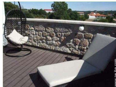
Instalaciones de ocio