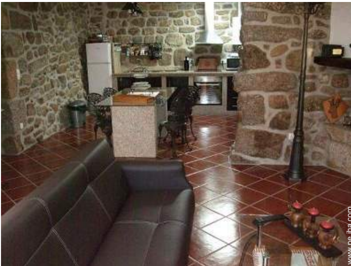
Disposición interior privado