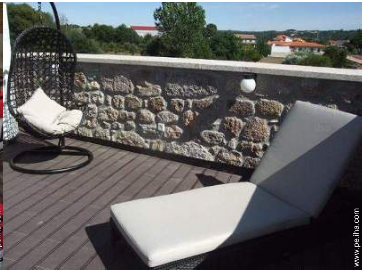
Instalaciones de ocio