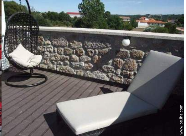
Instalaciones de ocio