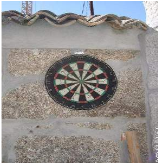
Instalaciones de ocio