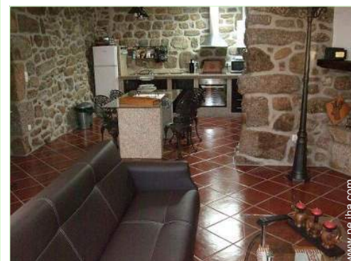
Disposición interior privado