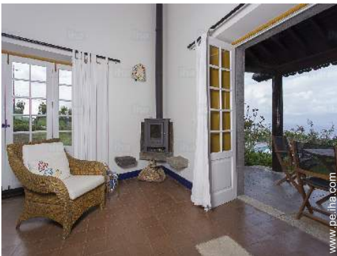
vista desde el cuarto de estar