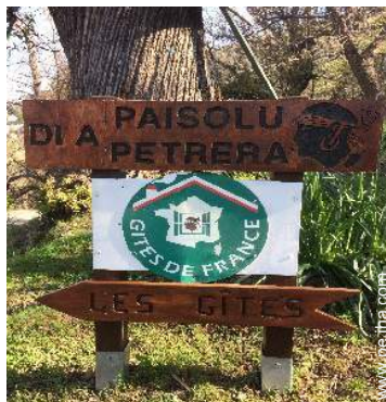
Presencia en el lugar