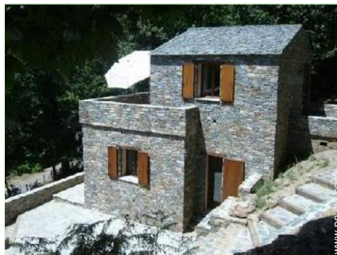
vista sobre la montaña