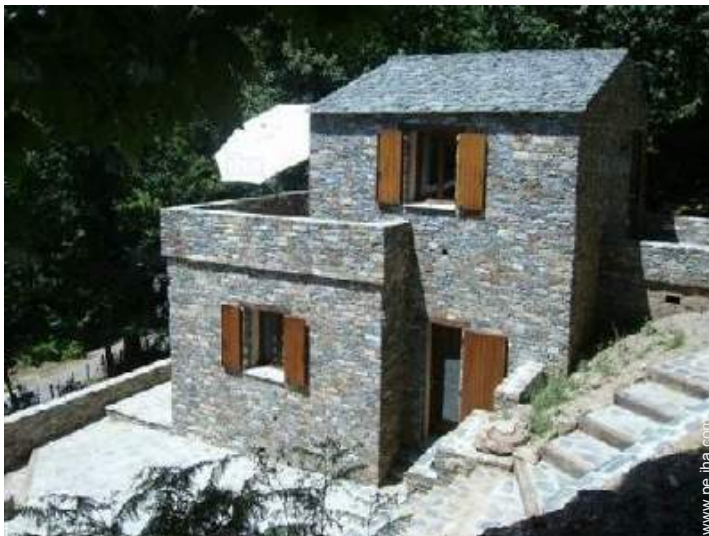
vista sobre la montaña